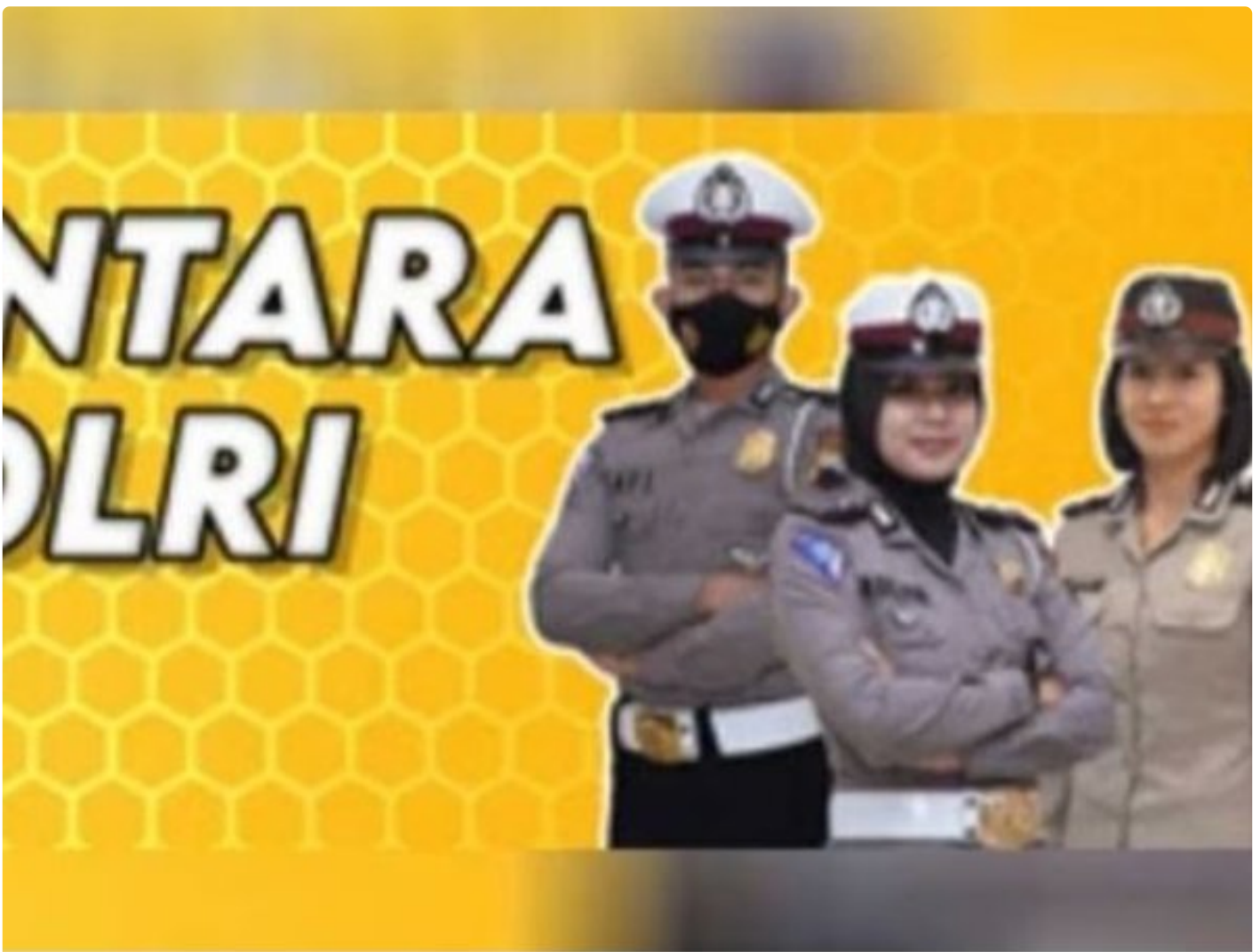
Penerimaan Polri Bakomsus

PALANGKA RAYA - Kesempatan terbuka bagi lulusan bidang pertanian, perikanan, peternakan, gizi, dan kesehatan masyarakat untuk bergabung menjadi anggota Polri melalui program penerimaan Bintara Kompetensi Khusus (Bakomsus).